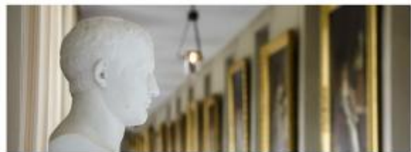
Le musée Napoléon 1er