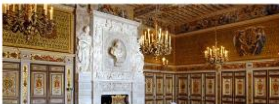
Les grands appartements des souverains