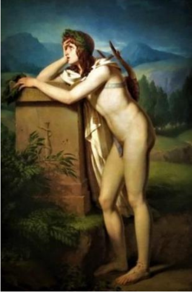
Pierre-Narcisse Guérin [Paris, 1774 – Rome, 1833] , Orphée pleurant sur le tombeau d'Eurydice , 1798-1800